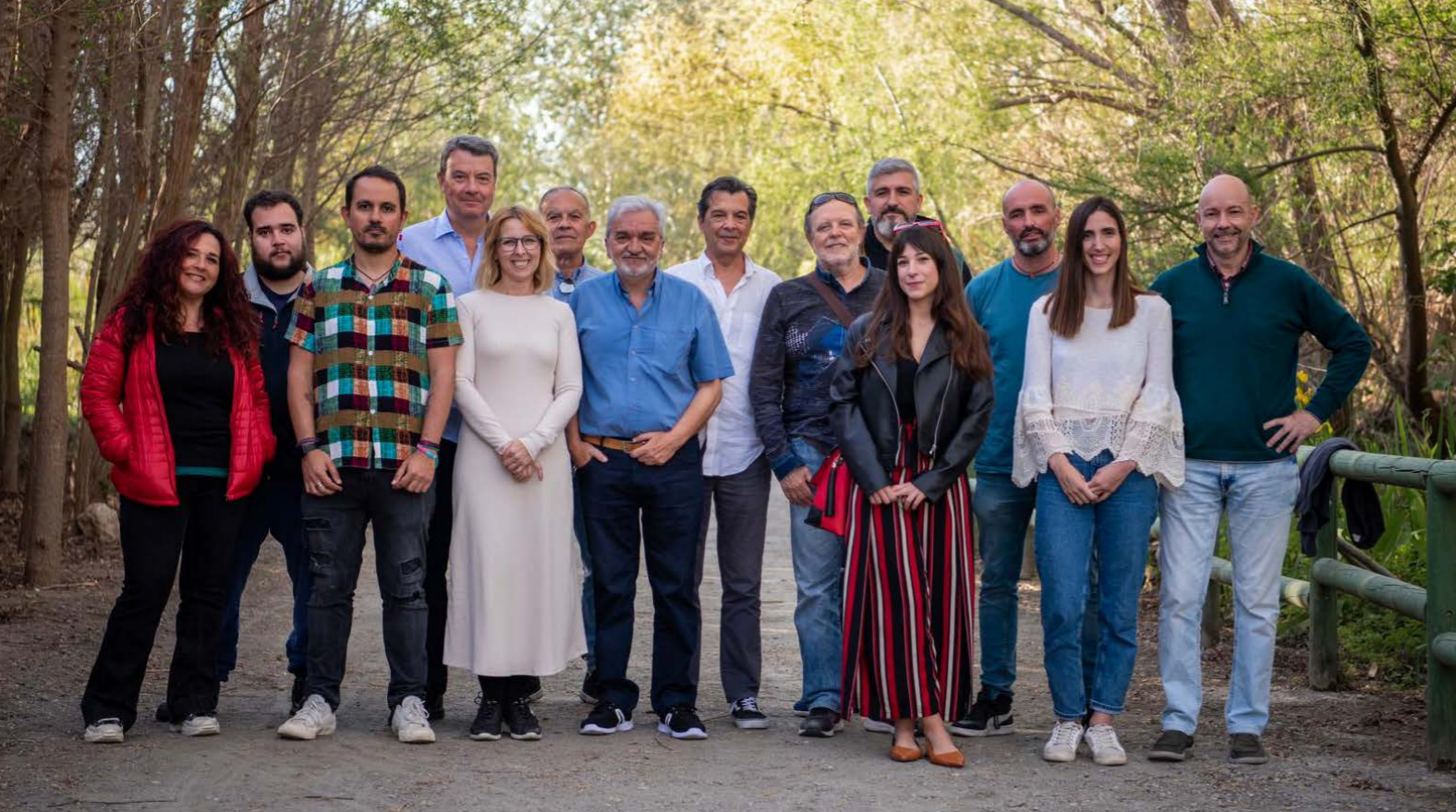
Candidatura Municipal 2023 Izquierda Unida y Verdes Equo